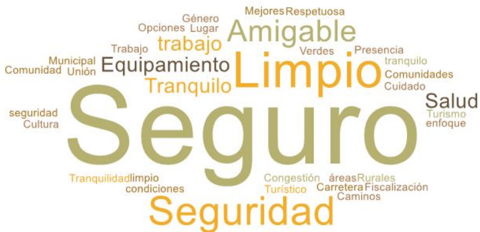
Imagen 1. Nube de palabras elaboradas de los conceptos presentados en esta parte del taller

En esta primera fase del encuentro, se reforzó la importancia del Plan de Desarrollo Comunal y cómo incide la participación ciudadana dentro del proceso. El objetivo de esta etapa es conocer el ideal de un Puerto Montt futuro, en voz de las vecinas y vecinos del sector de Chaica.