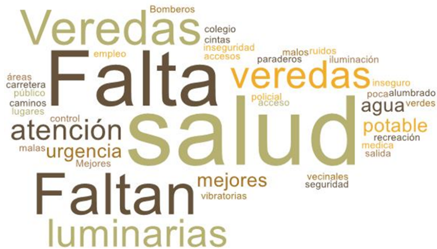
Imagen 2. Nube de palabras elaboradas de los conceptos presentados en esta parte del taller

Las tres mesas expusieron las distintas problemáticas que como sector, se ven enfrentadas y enfrentados a diario. Uno de los problemas que fue más abordado entre las vecinas y vecinos, de forma transversal, fue la falta de acceso a atención de salud, principalmente respecto al acceso a especialistas y a una atención de urgencia.