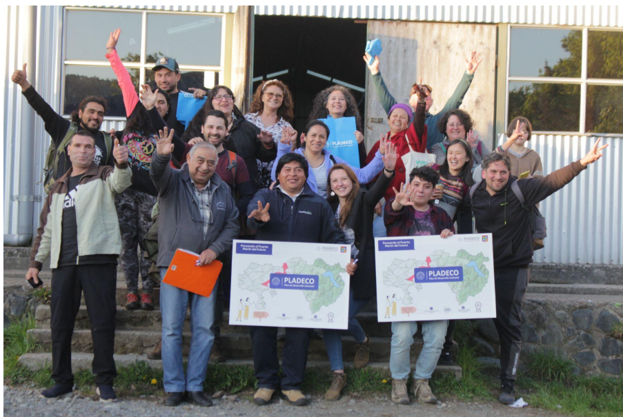
Fotografía Escuela Rural Correntoso

A continuación, se presentan los principales resultados de este proceso, el que incluye una descripción general de las personas que participaron en la mesa, su pertenencia territorial, la visión de futuro que tienen sobre Puerto Montt, los principales problemas del sector y de la comuna junto a las soluciones propuestas.