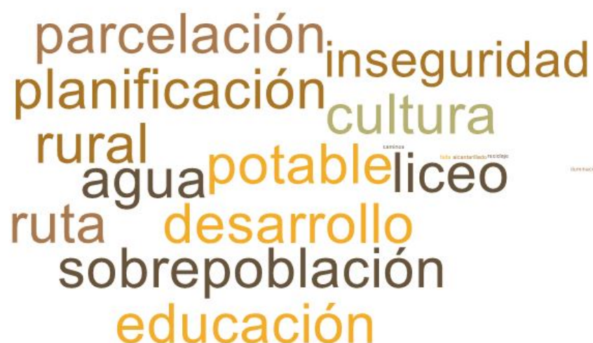
Imagen 2. Nube de palabras elaboradas de los conceptos presentados en esta parte del taller