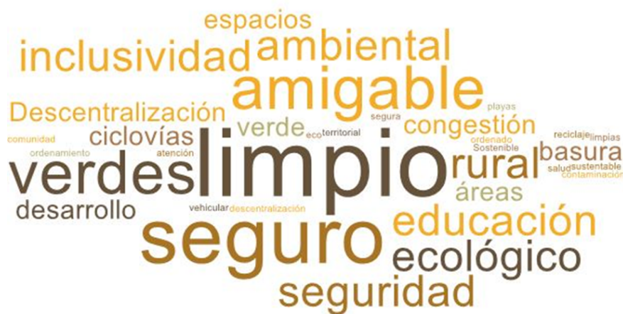
Imagen 1. Nube de palabras elaboradas de los conceptos presentados en esta parte del taller

En esta primera fase del encuentro, se reforzó la importancia del Plan de Desarrollo Comunal y cómo incide la participación ciudadana dentro del proceso. El objetivo de esta etapa es conocer el ideal de un Puerto Montt futuro, en voz de las vecinas y vecinos del sector de Correntoso.