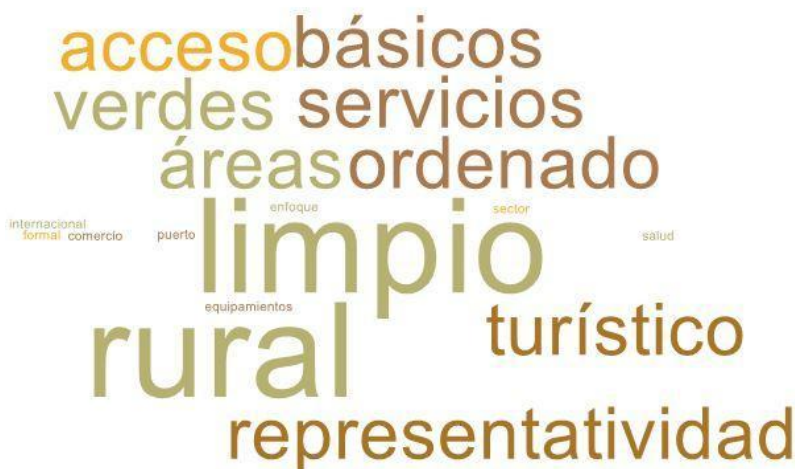
Imagen 1. Nube de palabras elaboradas de los conceptos presentados en esta parte del taller

En esta primera fase del encuentro, se reforzó la importancia del Plan de Desarrollo Comunal y cómo incide la participación ciudadana dentro del proceso. El objetivo de esta etapa es conocer el ideal de un Puerto Montt futuro, en voz de las vecinas y vecinos del sector de Lenca.