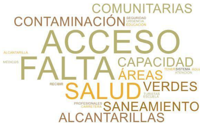
Imagen 2. Nube de palabras elaboradas de los conceptos presentados en esta parte del taller

En esta segunda etapa, las mesas se dispusieron a evaluar y discutir los principales problemas de su territorio y cómo estos les afectan de forma particular y colectivamente a cada integrante.