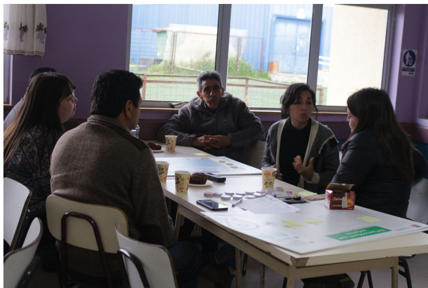
Fotografía Escuela Rural Lenca

A continuación, se presentan los principales resultados de este proceso, el que incluye una descripción general de las personas que participaron en la mesa, su pertenencia territorial, la visión de futuro que tienen sobre Puerto Montt, los principales problemas del sector y de la comuna junto a las soluciones propuestas.