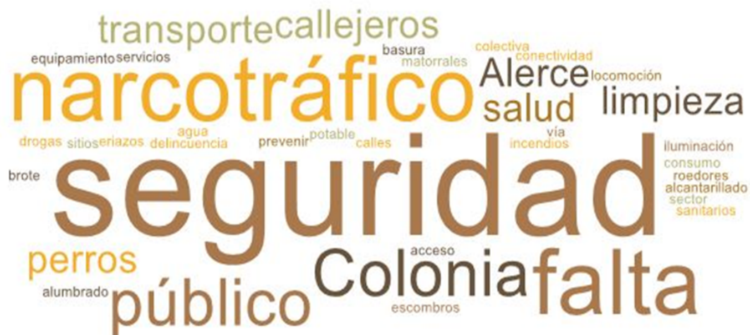
Imagen 2. Nube de palabras elaboradas de los conceptos presentados en esta parte del taller

En esta segunda etapa, la mesa se dispuso a evaluar y discutir los principales problemas de su territorio y cómo estos les afectan de forma particular y colectivamente a la mesa. La siguiente nube de palabras refleja estas visiones.