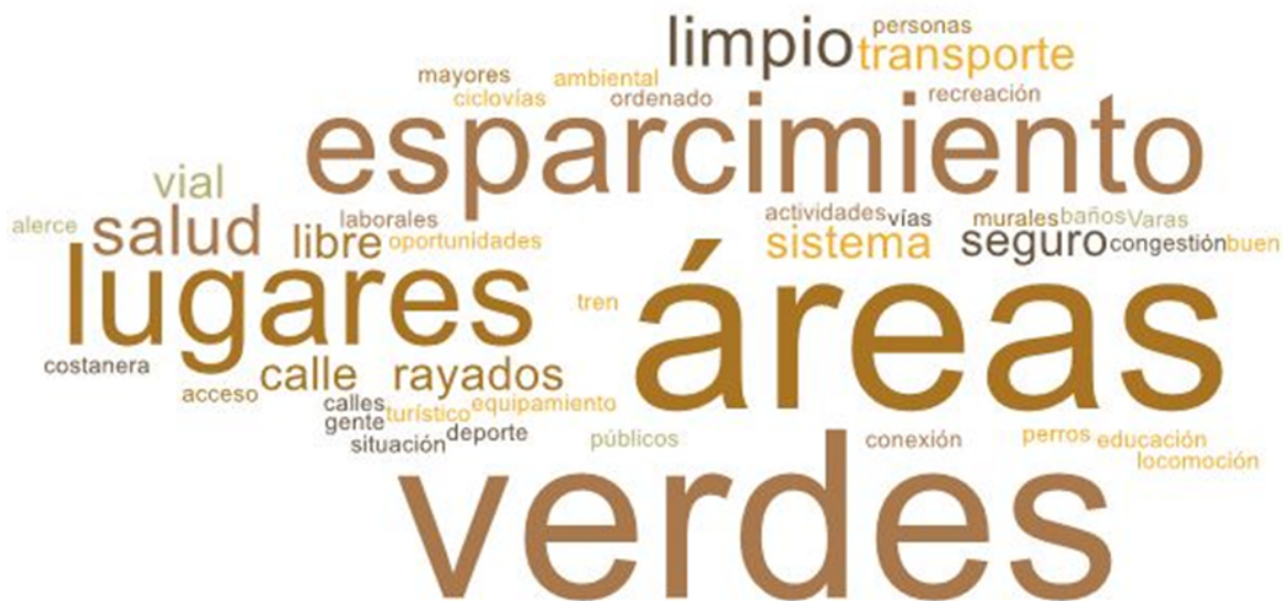
Imagen 1. Nube de palabras elaboradas de los conceptos presentados en esta parte del taller

En esta primera fase del encuentro, se reforzó la importancia del Plan de Desarrollo Comunal y cómo incide la participación ciudadana dentro del proceso. El objetivo de esta etapa es conocer el ideal de un Puerto Montt futuro, en voz de las vecinas del sector.