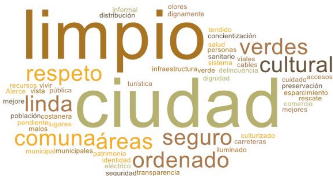
Imagen 1. Nube de palabras elaboradas de los conceptos presentados en esta parte del taller

En esta primera fase del encuentro, se reforzó la importancia del Plan de Desarrollo Comunal y cómo incide la participación ciudadana dentro del proceso. El objetivo de esta etapa es conocer el ideal de un Puerto Montt futuro, en voz de las vecinas y vecinos del sector de Alerce Sur.