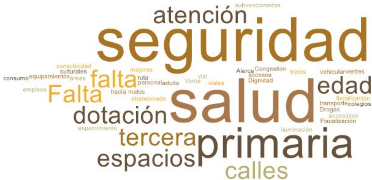
Imagen 2. Nube de palabras elaboradas de los conceptos presentados en esta parte del taller

En esta segunda etapa, las mesas se dispusieron a evaluar y discutir los principales problemas de su territorio y cómo estos les afectan de forma particular y colectivamente a cada integrante.