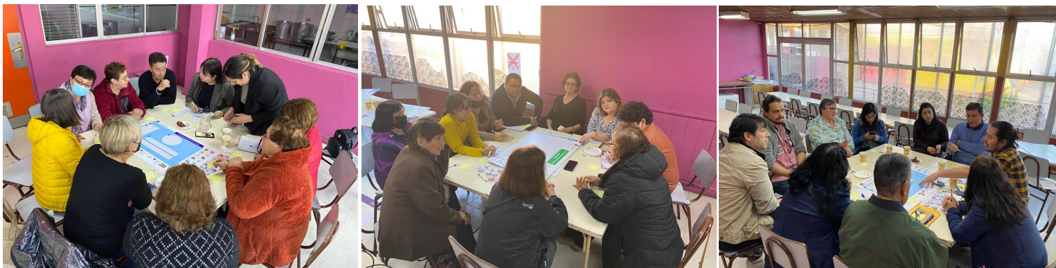
Fotografía Escuela Árabe Siria

A continuación, se presentan los principales resultados de este proceso, el que incluye una descripción general de las personas que participaron en la mesa, su pertenencia territorial, la visión de futuro que tienen sobre Puerto Montt, los principales problemas de la comuna y del sector junto a las soluciones propuestas.