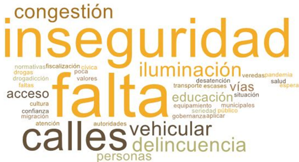
Imagen 2. Nube de palabras elaboradas de los conceptos presentados en esta parte del taller

En esta segunda etapa, las mesas se dispusieron a evaluar y discutir los principales problemas de la comuna y cómo estos les afectan de forma particular y colectivamente a cada integrante.