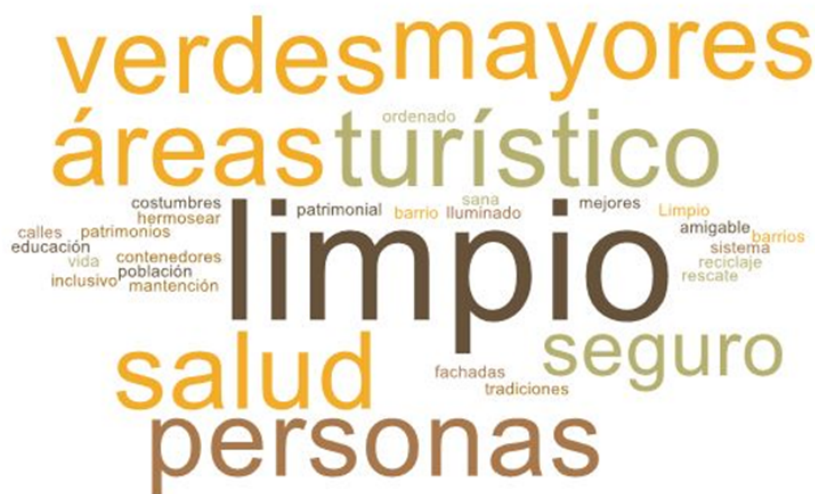
Imagen 1. Nube de palabras elaboradas de los conceptos presentados en esta parte del taller

En esta primera fase del encuentro, se reforzó la importancia del Plan de Desarrollo Comunal y cómo incide la participación ciudadana dentro del proceso. El objetivo de esta etapa es conocer el ideal de un Puerto Montt futuro, en voz de las vecinas y vecinos del sector Poniente.