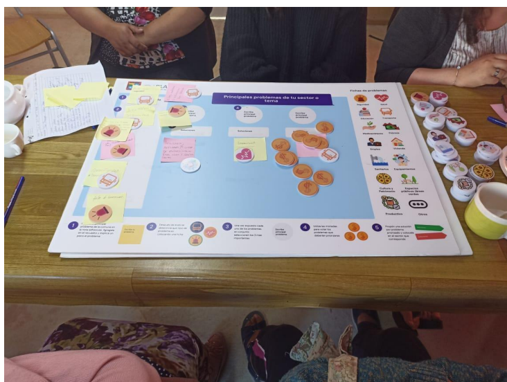
Fotografía dinámica del taller

Finalmente, desde la mesa surge las carreras clandestinas que tienen lugar en las calles más largas del sector, mencionan que estas suelen darse los fines de semana en las noches y muchas veces las fuerzas policiales no llegan al sector al ser contactados por los vecinos.