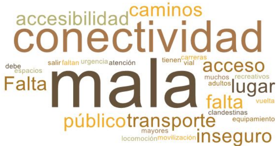
Imagen 2. Nube de palabras elaboradas de los conceptos presentados en esta parte del taller

La anterior nube de palabras manifiesta las necesidades que inquietan a las vecinas y vecinos del sector de Llanos de Tenglo. Predominando la mala conectividad que tienen los habitantes del sector con el resto de la ciudad, señalan que solo tienen dos vías de acceso al lugar, por un lado, un camino privado que los une con el sector de Bosquemar y otro que los une con la Panamericana 5 Sur.