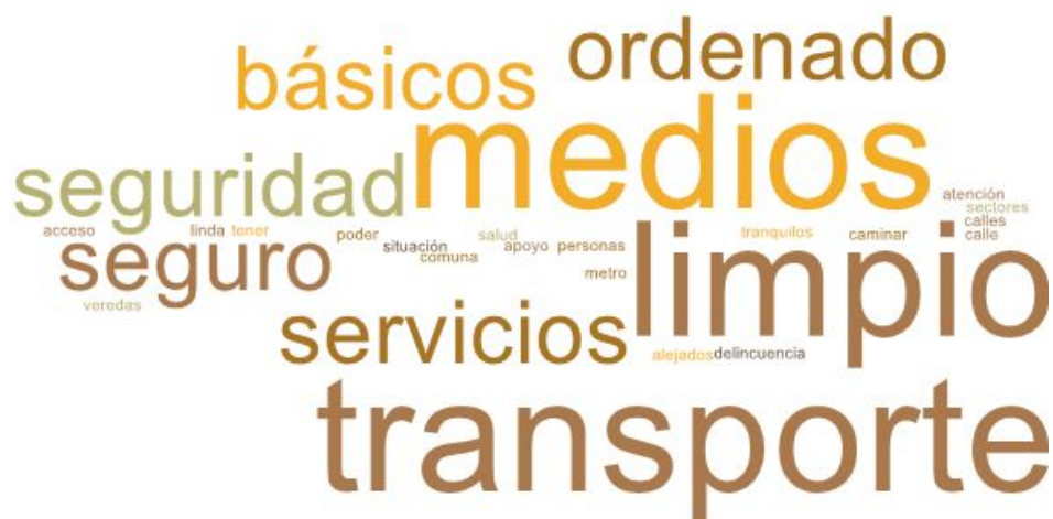
Imagen 1. Nube de palabras elaboradas de los conceptos presentados en esta parte del taller

En esta primera fase del encuentro, se reforzó la importancia del Plan de Desarrollo Comunal y cómo incide la participación ciudadana dentro del proceso. El objetivo de esta etapa es conocer el ideal de un Puerto Montt futuro, en voz de las vecinas y vecinos del sector de Llanos de Tenglo.