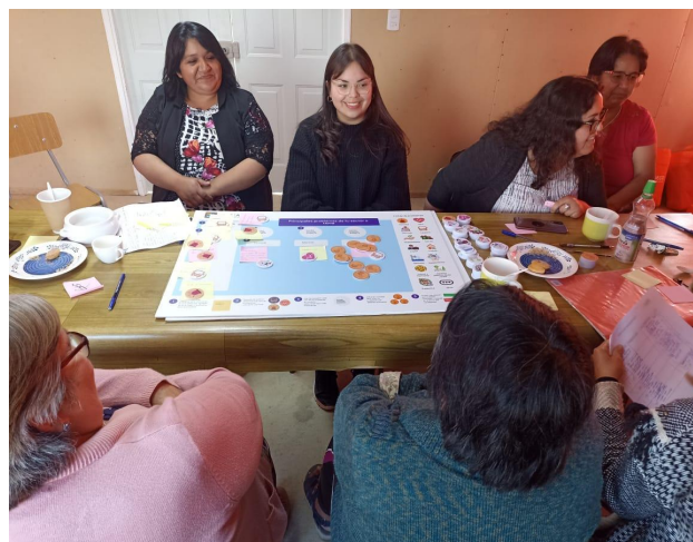
Fotografía Junta de vecinos sector Llanos de Tenglo