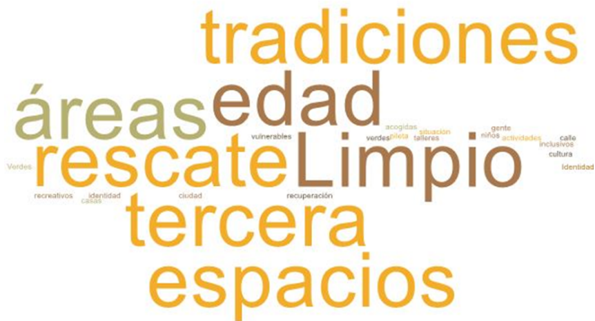
Imagen 1. Nube de palabras elaboradas de los conceptos presentados en esta parte del taller

En esta primera fase del encuentro, se reforzó la importancia del Plan de Desarrollo Comunal y cómo incide la participación ciudadana dentro del proceso. El objetivo de esta etapa es conocer el ideal de un Puerto Montt futuro, en voz de las vecinas del sector de Pichi Pelluco.