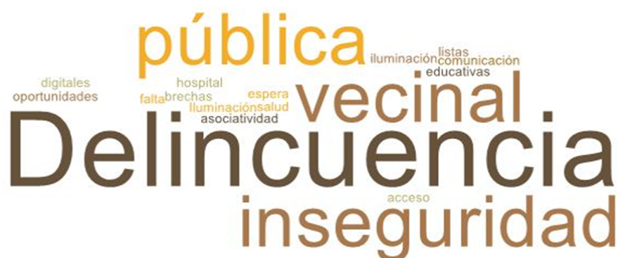
Imagen 2. Nube de palabras elaboradas de los conceptos presentados en esta parte del taller