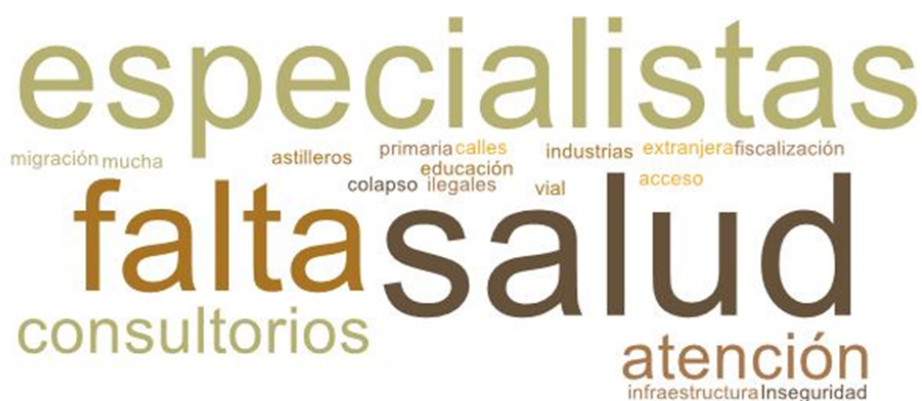
Imagen 2. Nube de palabras elaboradas de los conceptos presentados en esta parte del taller