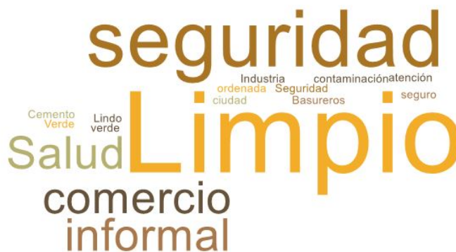
Imagen 1. Nube de palabras elaboradas de los conceptos presentados en esta parte del taller

En esta primera fase del encuentro, se reforzó la importancia del Plan de Desarrollo Comunal y cómo incide la participación ciudadana dentro del proceso. El objetivo de esta etapa es conocer el ideal de un Puerto Montt futuro, en voz de las y los vecinos del sector de Anahuac