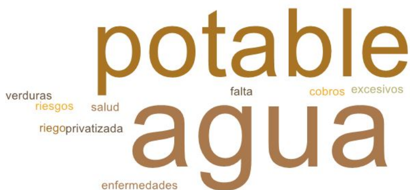
Imagen 2. Nube de palabras elaboradas de los conceptos presentados en esta parte del taller

En esta segunda etapa, la mesa se dispuso a evaluar y discutir los principales problemas de su territorio y cómo estos les afectan de forma particular y colectivamente a la mesa. La siguiente nube de palabras refleja estas visiones.