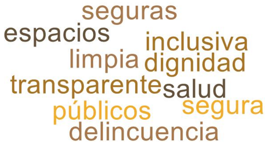
Imagen 1. Nube de palabras elaboradas de los conceptos presentados en esta parte del taller

En esta primera fase del encuentro, se reforzó la importancia del Plan de Desarrollo Comunal y cómo incide la participación ciudadana dentro del proceso. El objetivo de esta etapa es conocer el ideal de un Puerto Montt futuro, en voz de las vecinas y vecinos del sector de Isla Tenglo.