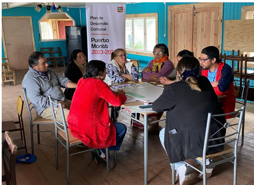
Fotografía Sede Social sector Capilla

A continuación, se presentan los principales resultados de este proceso, el que incluye una descripción general de las personas que participaron en las mesas, su pertenencia territorial, la visión de futuro que tienen sobre Puerto Montt, los principales problemas del sector y de la comuna junto a las soluciones propuestas.