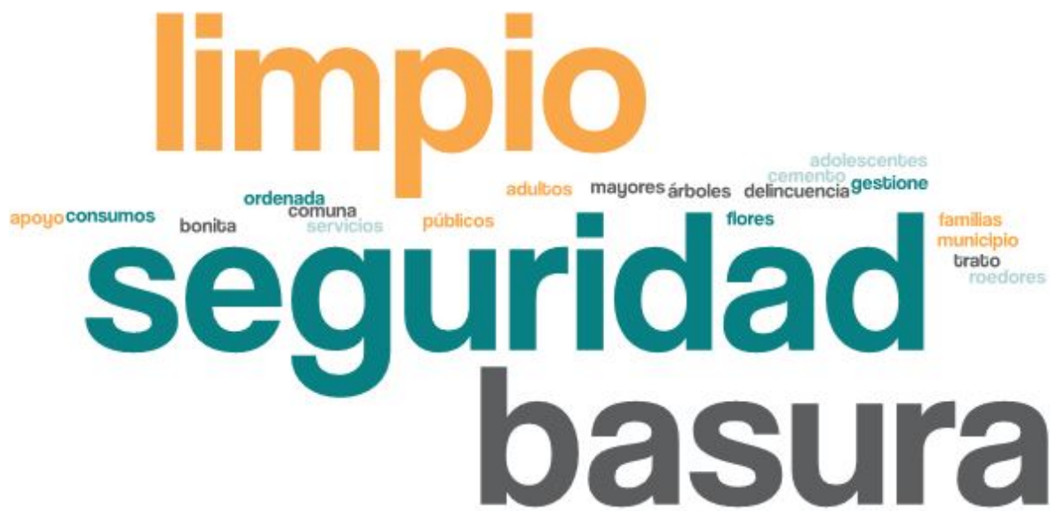
Imagen 1. Nube de palabras elaboradas de los conceptos presentados en esta parte del taller

En esta primera fase del encuentro, se reforzó la importancia del Plan de Desarrollo Comunal y cómo incide la participación ciudadana dentro del proceso. El objetivo de esta etapa es conocer el ideal de un Puerto Montt futuro, en voz de las vecinas y vecinos del sector.