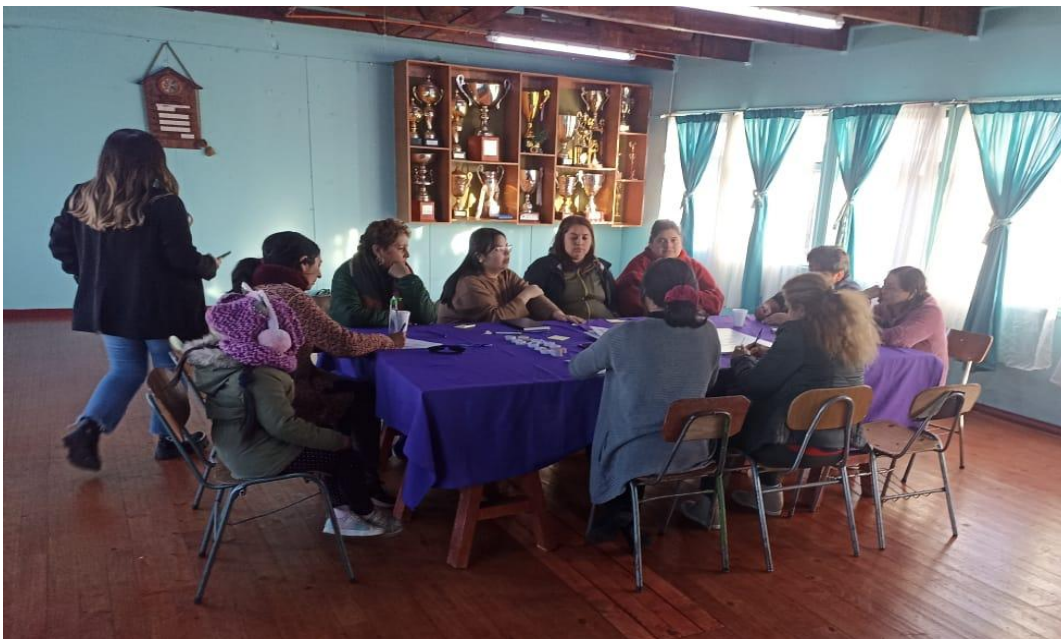
Fotografía Sede Vecinal Chile Barrio

A continuación, se presentan los principales resultados de este proceso, el que incluye una descripción general de las personas que participaron en la mesa, su pertenencia territorial, la visión de futuro que tienen sobre Puerto Montt, los principales problemas del sector y de la comuna junto a las soluciones propuestas.