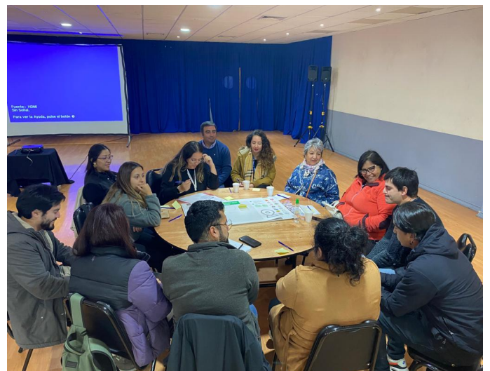
Fotografías en la sala Anahuac recinto La Arena