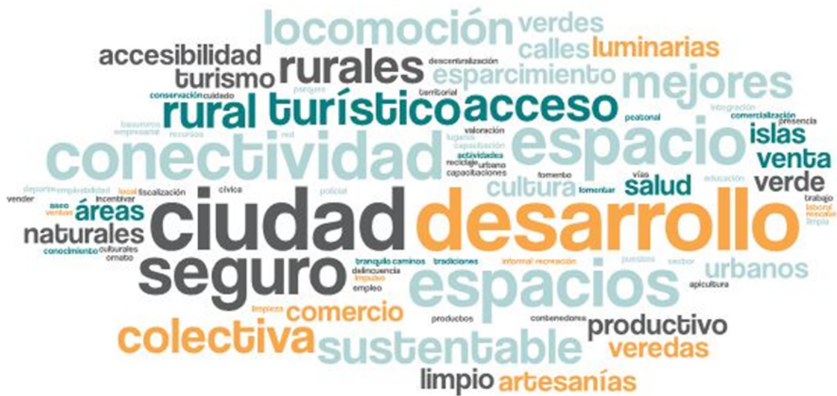
Imagen 1. Nube de palabras elaboradas de los conceptos presentados en esta parte del taller

En esta primera fase del encuentro, se reforzó la importancia del Plan de Desarrollo Comunal y cómo incide la participación ciudadana dentro del proceso, posteriormente se dio a conocer el tablero de trabajo y la dinámica que se llevaría a cabo, tanto metodológicamente como el proceso participativo de cada uno de los y las asistentes. El objetivo de esta etapa es conocer el ideal de un Puerto Montt futuro, en voz de las y los representantes de la temática desarrollo económico y trabajo.