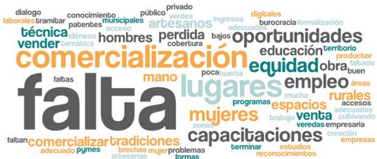
Imagen 2. Nube de palabras elaboradas de los conceptos presentados en esta parte del taller

En esta segunda etapa, las mesas se dispusieron a evaluar y discutir los principales problemas de su entorno y cómo estos les afectan de forma particular y colectivamente a las mesas. Si bien las mesas trabajaron de forma separada, las problemáticas fueron transversales.