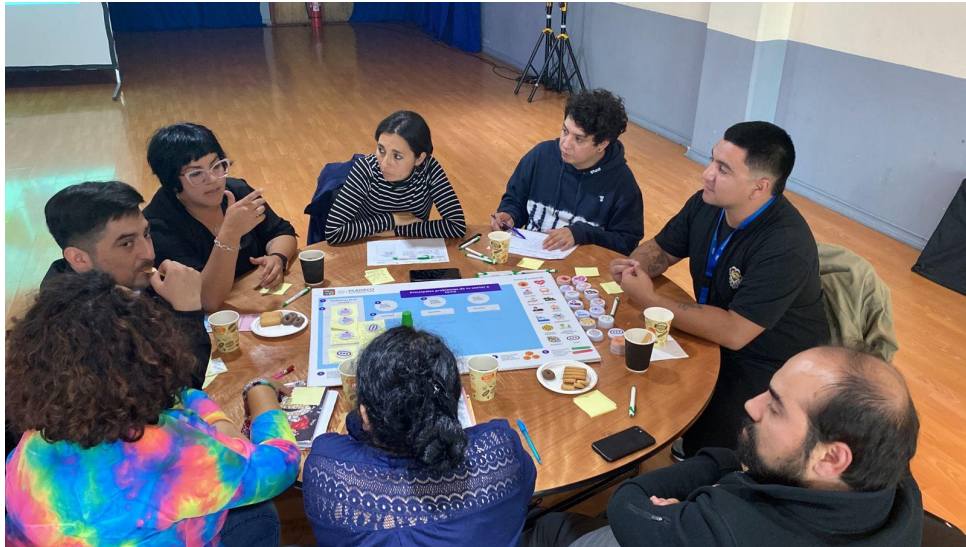
Fotografías en la sala Anahuac recinto La Arena