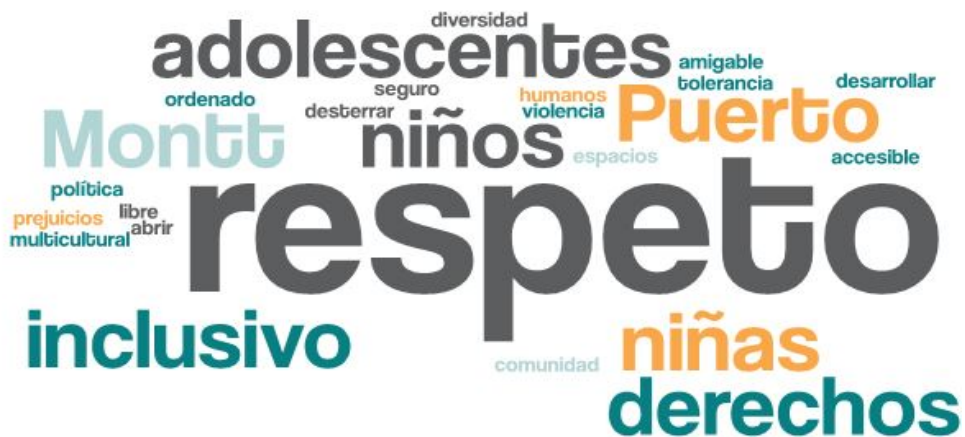
Imagen 1. Nube de palabras elaboradas de los conceptos presentados en esta parte del taller

En esta primera fase del encuentro, se reforzó la importancia del Plan de Desarrollo Comunal y cómo incide la participación ciudadana dentro del proceso, posteriormente se dio a conocer el tablero de trabajo y la dinámica que se llevaría a cabo, tanto metodológicamente como el proceso participativo de los y las asistentes. El objetivo de esta etapa es conocer el ideal de un Puerto Montt futuro, en voz de las y los representantes de la temática de las diversidades. La siguiente nube de palabras da cuenta de ello.