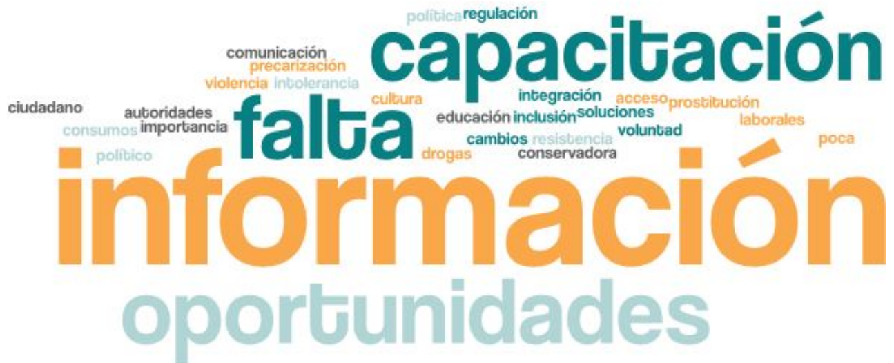
Imagen 2. Nube de palabras elaboradas de los conceptos presentados en esta parte del taller

En esta segunda etapa, las mesas se dispusieron a evaluar y discutir los principales problemas de la temática en torno a la diversidad y cómo estos les afectan de forma particular y colectivamente a la mesa. La siguiente nube de palabras da cuenta de ello.