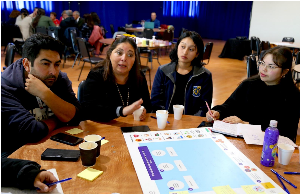
Fotografías en la sala Angelmó recinto La Arena