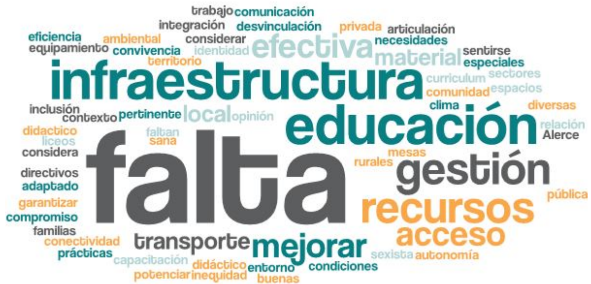
Imagen 2. Nube de palabras elaboradas de los conceptos presentados en esta parte del taller

Entre las problemáticas más mencionadas por las y los participantes se encuentra la falta de infraestructura y la gestión de los recursos en educación. Las y los asistentes manifiestan las dificultades que tienen los distintos establecimientos educacionales respecto a condiciones mínimas de infraestructura y equipamiento. Se señalan ejemplos en donde habrían establecimientos con serios problemas de espacio, que no cuentan con techos adecuados, con gimnasios o con un patio que permita a las y los estudiantes poder realizar actividades de forma segura.