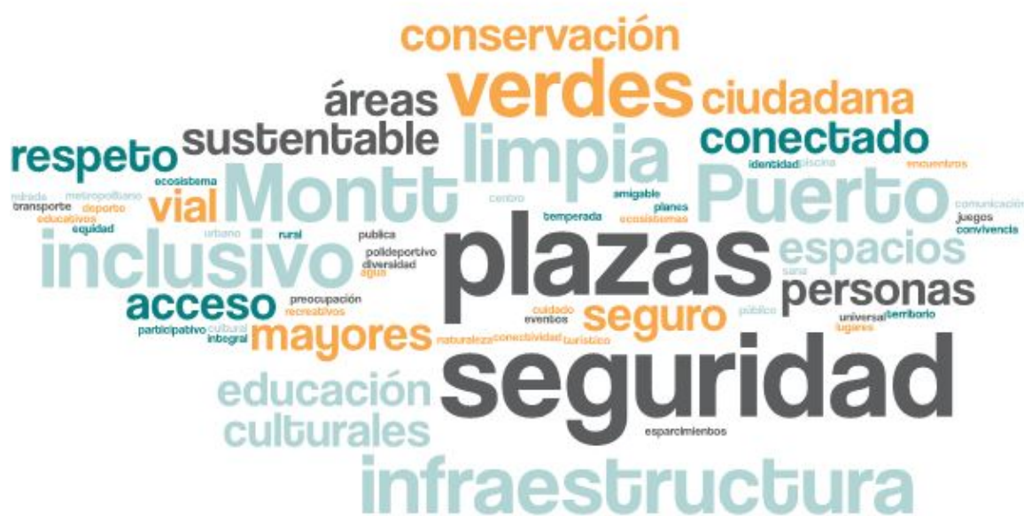
Imagen 1. Nube de palabras elaboradas de los conceptos presentados en esta parte del taller

En esta primera fase del encuentro, se reforzó la importancia del Plan de Desarrollo Comunal y cómo incide la participación ciudadana dentro del proceso, posteriormente se dio a conocer el tablero de trabajo y la dinámica que se llevaría a cabo, tanto metodológicamente como el proceso participativo de cada uno de los y las asistentes. El objetivo de esta etapa es conocer el ideal de un Puerto Montt futuro, en voz de las y los representantes de la temática de educación.