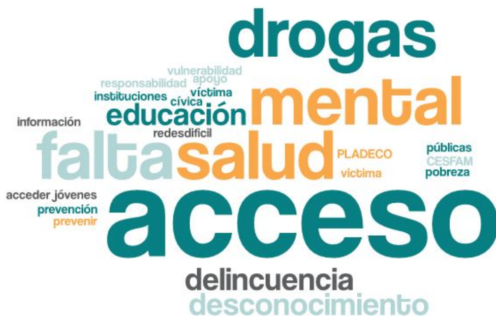
Imagen 2. Nube de palabras elaboradas de los conceptos presentados en esta parte del taller

En esta segunda etapa, la mesa se dispuso a evaluar y discutir los principales problemas en torno a la temática juventud y cómo estos les afectan de forma particular y colectivamente a la mesa. La siguiente nube de palabras da cuenta de las principales problemáticas manifestadas por las y los participantes del taller.