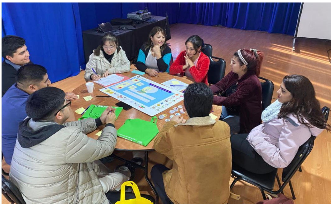
Fotografías en la sala Anahuac recinto La Arena

A continuación, se presentan los principales resultados de este proceso, el que incluye una descripción general de las personas que participaron en la mesa, la visión de futuro que tienen sobre Puerto Montt, los principales problemas en torno a la temática jóvenes y las principales problemáticas de la comuna junto a las soluciones propuestas.