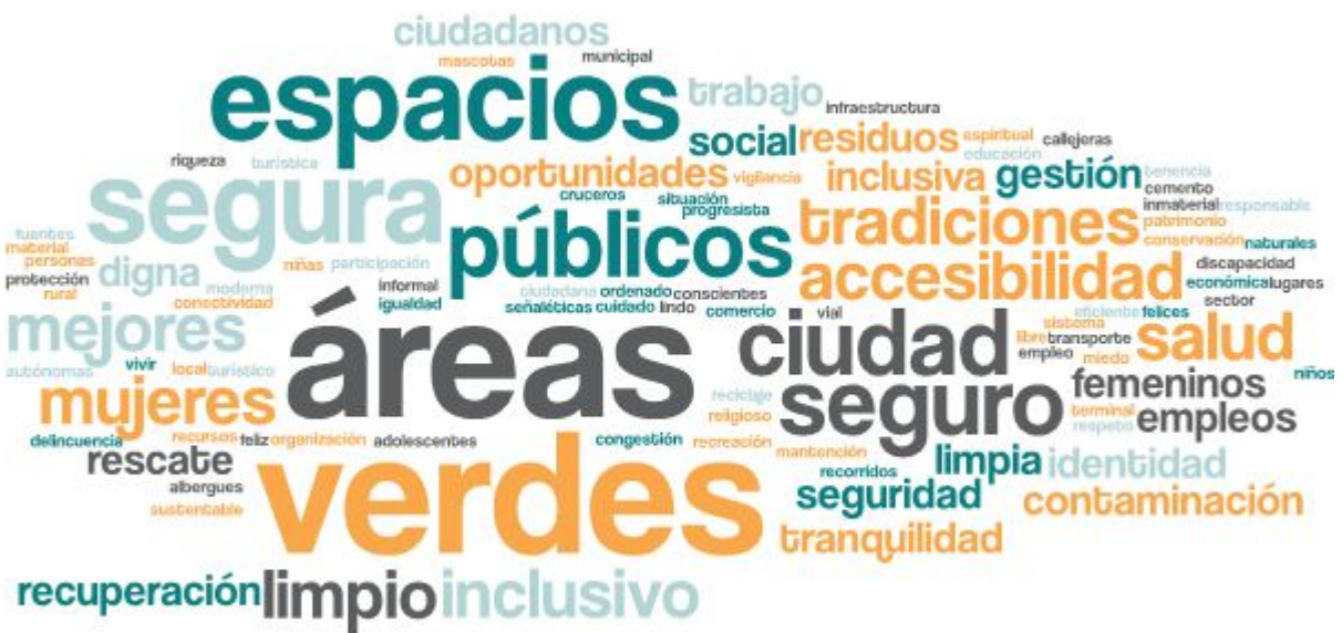
Imagen 1. Nube de palabras elaboradas de los conceptos presentados en esta parte del taller

Las asistentes levantaron diferentes aspiraciones en torno a la comuna, desde sus diversas formas de habitar el extenso territorio. Un sueño transversal entre las tres mesas fue el querer una ciudad comprometida y más verde, señalan que la creación de áreas verdes y espacios con fines recreativos sería clave para un mejor vivir de las personas. A su vez, indican la importancia de que las y los ciudadanos respeten los espacios otorgados para todos y todas.