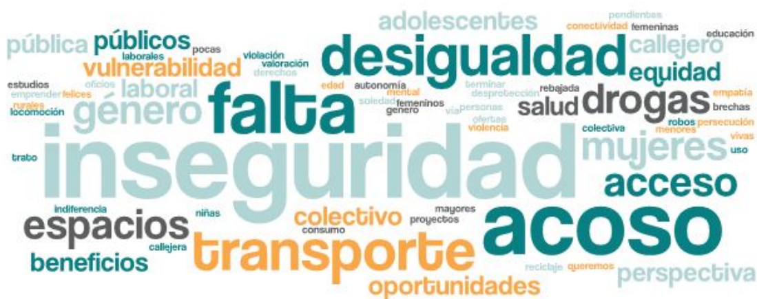
Imagen 2. Nube de palabras elaboradas de los conceptos presentados en esta parte del taller

En esta segunda etapa, las mesas se dispusieron a evaluar y discutir los principales problemas de su entorno y cómo estos les afectan de forma particular y colectivamente a las mesas. Si bien las participantes trabajaron de forma separada, las problemáticas fueron transversales. La siguiente nube da cuenta de ello.