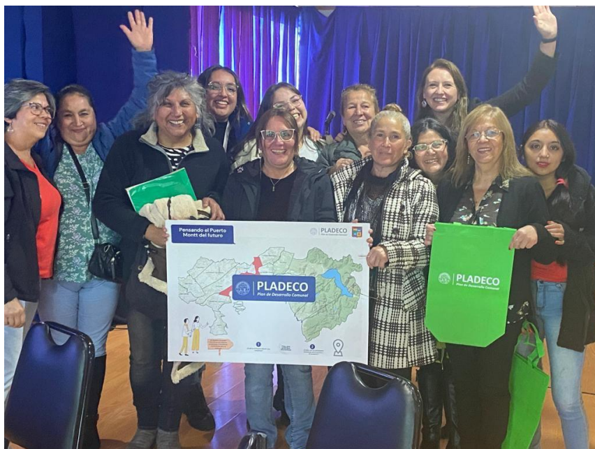
Fotografías en la sala Anahuac recinto La Arena