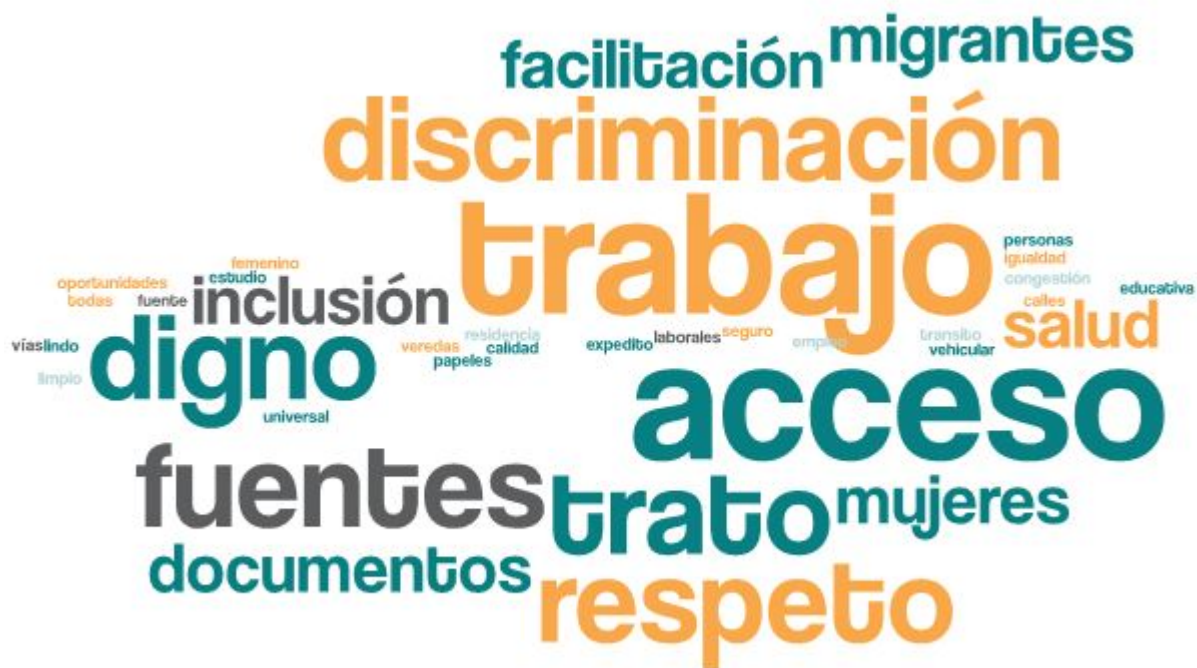
Imagen 1. Nube de palabras elaboradas de los conceptos presentados en esta parte del taller

Las y los participantes de las dos mesas de trabajo tuvieron distintas miradas respecto a cómo sueñan la comuna en los próximos años, entre las ideas que más afloran desde la anterior nube de palabras, fue soñar con una ciudad más respetuosa, aludiendo al trato interpersonal entre los y las ciudadanas. Señalan que en más de una ocasión han sido propiamente discriminados. En esta misma línea imaginan una ciudad que no vulnere los derechos de las personas migrantes especialmente desde la esfera laboral.