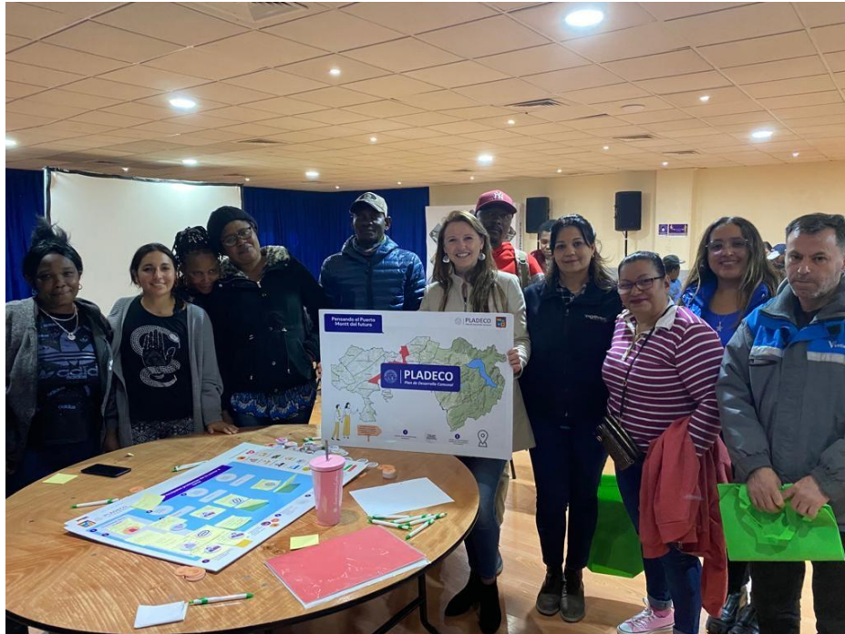
Fotografías en la sala Anahuac recinto La Arena