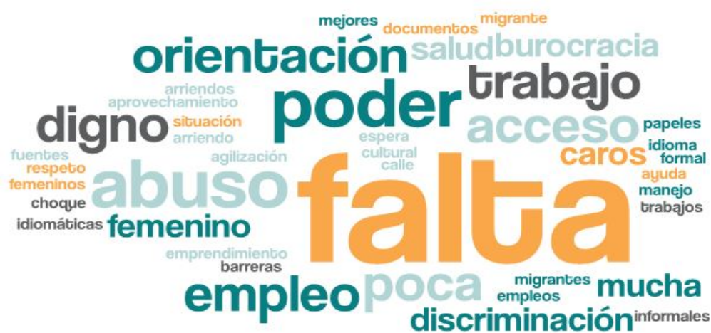
Imagen 2. Nube de palabras elaboradas de los conceptos presentados en esta parte del taller.

En esta segunda etapa, las mesas se dispusieron a evaluar y discutir los principales problemas de la temática de personas migrantes y cómo estos les afectan de forma particular y colectivamente a las mesas. La siguiente nube de palabras da cuenta de ello.