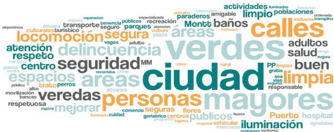
Imagen 1. Nube de palabras elaboradas de los conceptos presentados en esta parte del taller

En esta primera fase del encuentro, se reforzó la importancia del Plan de Desarrollo Comunal y cómo incide la participación ciudadana dentro del proceso, posteriormente se dio a conocer el tablero de trabajo y la dinámica que se llevaría a cabo, tanto metodológicamente como el proceso participativo de cada uno de los y las asistentes. El objetivo de esta etapa es conocer el ideal de un Puerto Montt futuro, en voz de las personas mayores, provenientes de diversas partes de la comuna. La siguiente nube de palabras da cuenta de ello: