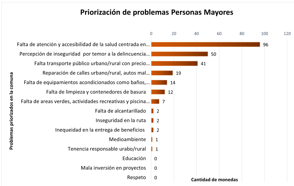
Gráfico 1. Priorización de las 41 mesas de trabajo. Problemas priorizados y la cantidad de monedas otorgadas.

Los tres problemas mayormente escogidos fueron: en primer lugar la falta de atención y accesibilidad de la salud centrada en la espera, infraestructura, horas médicas y falta de un centro exclusivo de Personas mayores. En segundo lugar la percepción de inseguridad por temor a la delincuencia en las calles y en sus hogares. En tercer lugar, falta transporte público urbano/rural con precio rebajado, para una mejor conectividad en la comuna.