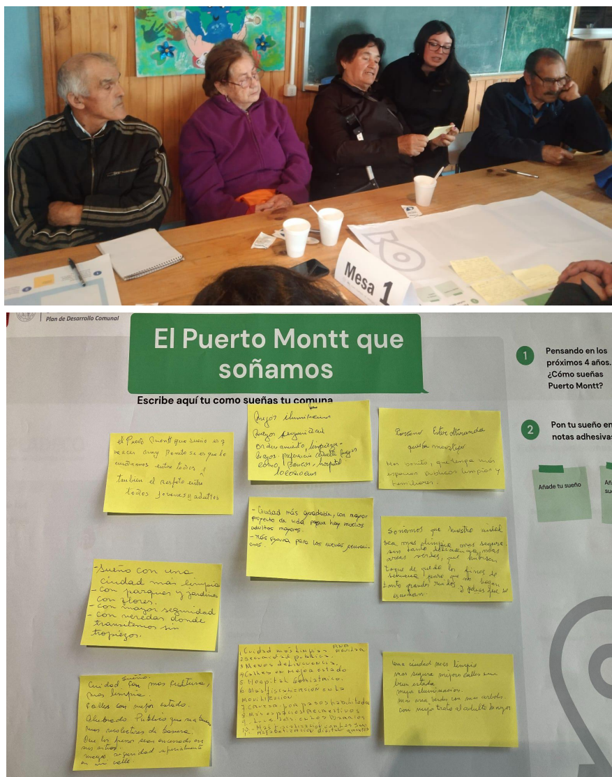
Figura 3. Fotografías de talleres de Personas Mayores.

Finalmente se manifiesta lo fundamental de tener actividades recreativas todo el año, de carácter descentralizado y con acceso a todas las personas mayores, señalan que las charlas, bailes, juegos lúdicos, viajes y diversos encuentros entre la comunidad mayor, son acciones distintas a su quehacer cotidiano, que en voz de las y los participantes, los hace parte de una agenda de vivencias y anécdotas que aumentan su buen vivir.