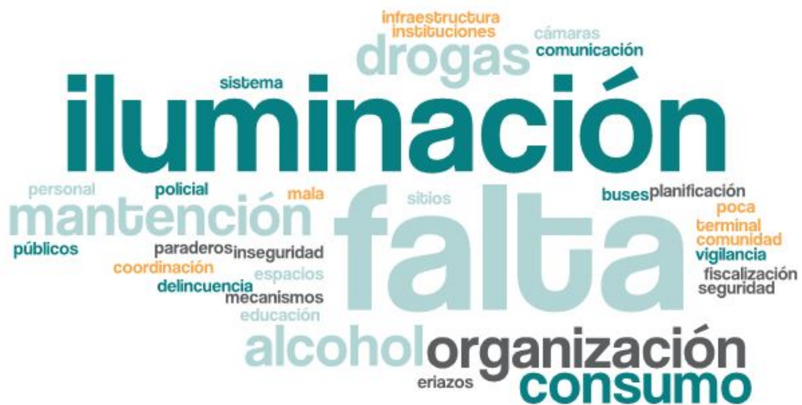
Imagen 2. Nube de palabras elaboradas de los conceptos presentados en esta parte del taller

Entre las problemáticas más mencionadas por las y los participantes se encuentran, por una parte, aquellas que tienen que ver con la falta de infraestructura o mantención de equipamientos, y por otro, con la falta de organización comunitaria entre las y los vecinos de los distintos barrios de la comuna.