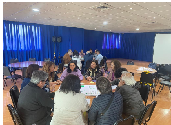
Fotografías en la sala Angelmó recinto La Arena