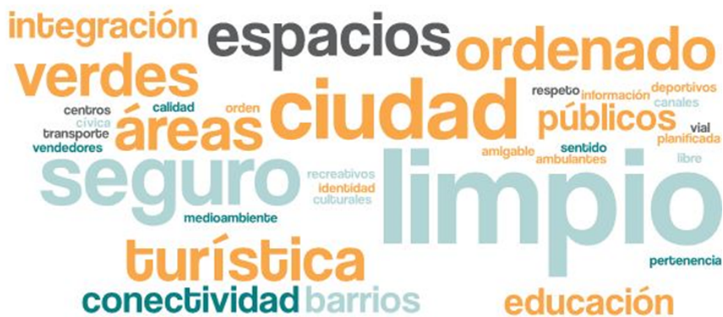
Imagen 1. Nube de palabras elaboradas de los conceptos presentados en esta parte del taller

En esta primera fase del encuentro, se reforzó la importancia del Plan de Desarrollo Comunal y cómo incide la participación ciudadana dentro del proceso, posteriormente se dio a conocer el tablero de trabajo y la dinámica que se llevaría a cabo, tanto metodológicamente como el proceso participativo de cada uno de los y las asistentes. El objetivo de esta etapa es conocer el ideal de un Puerto Montt futuro, en voz de las y los representantes de la temática de seguridad. La siguiente nube de palabras da cuenta de ello.